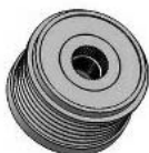
Koło pasowe sprzęgłowe (z wolnobiegiem) 6PK (6 rowków)

B+ - Akumulator (gruby przewód pod nakrętkę)