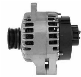
2 łapy montażowe (szeroka mocująca i wąska do naciągu)