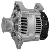
3 łapy montażowe ( 2 mocujące, 1 do naciagu)